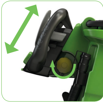
Ergonomisch: in de hoogte verstelbare bedieningshendel.