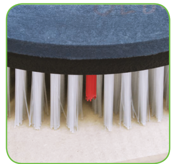
Borstel met gebruiksindicator.