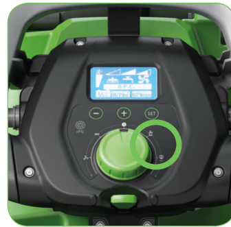
Ecologisch en economisch: 2 voorgeprogrammeerde programma's.