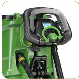
Gebruiksvriendelijk: volledige controle via 1 enkele centrale knop.